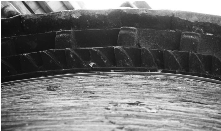
488. Rom, S. Lucia della Tinta, Apsis, Backsteingesims und Marmorkonsolen. (Foto Senekovic 2004)