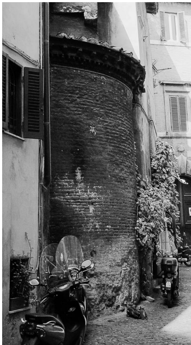
487. Rom, S. Lucia della Tinta, Außenansicht, Apsis.