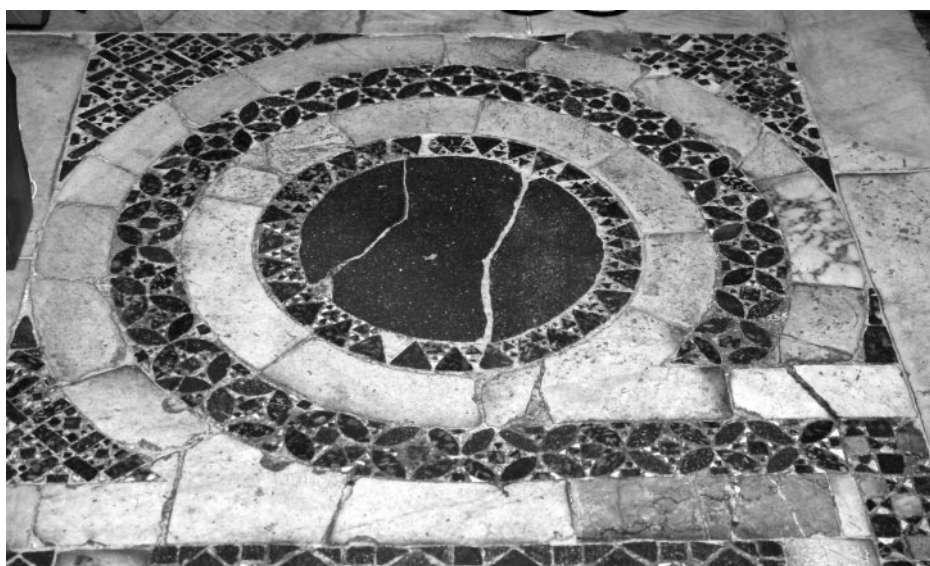
490. Rom, S. Lucia della Tinta. Reste des mittelalterlichen opus sectile -Bodens. Detail

geostet gelten kann und aufgrund der Quellen und Befunde eher nicht mit einem wesentlich erhöhten Chor zu rechnen ist, hat Panciroli mit Confessio wohl ein sichtbares Reliquienrepositorium im Altar oder eine Krypta gemeint. Aus seiner Anmerkung könnte man schließen, dass der Altar (und wohl der Apsisbereich) um 1625 noch mittelalterlich und nicht wesentlich verändert worden waren.